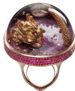
LIVELY & LOVELY DRAGON

L'amore più prezioso si tinge del rosso passionale dei rubini, delle rifrazioni dei diamanti bianchi e della lucentezza dei cuori in oro rosa. Sopra questo scenario romantico si posa leggera una coccinella in oro rosa.